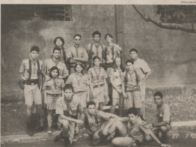
O grupo de pinhalenses presentes ao evento

Aconteceu nos dias 25 e 26 de julho, na cidade de Mococa, o I Acampamento Ponta de Flecha, destinado aos escoteiros graduados como monitores e sub-monitores de cada patrulha dos grupos da região Pô Impia.