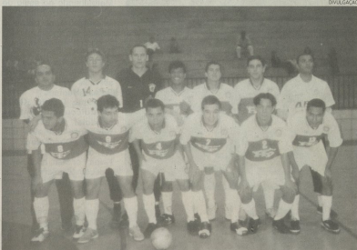
A equipe sub 21 que garantiu a classificação

A equipe pinhalense da Bio Forma/Departamento Municipal de Esportes acabou cedendo a vitória para