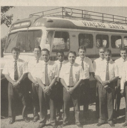
13 Motoristas Campeões