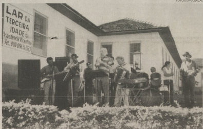
O conjunto animando a festa