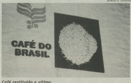
Café restituído a vítima