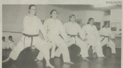
Equipe Chiva's Academia Edo-Kan

"Mas não deixa ninguém macumbado". A maioria das lutas define músculos sem exageros, queima calorias e dá elasticidade. Mas de qualquer que seja a motivação para abraçar uma ou outra, o fato é que as praticantes mudam postura diante de uma situação de tensão. Como conhecem seu poder de fogo, passam a controlar a raiva e a agir com mais equilíbrio. Cada prática tem o seu charme, por isso a melhor tática é experimentar. É impossível não se seduzir por alguma.