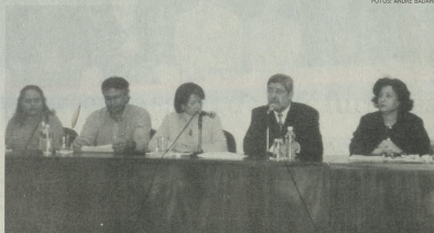
Mesa de assinaturas dos convênios, composta pelas autoridades

5- Programa do Idoso - este programa atende a 74 pessoas no