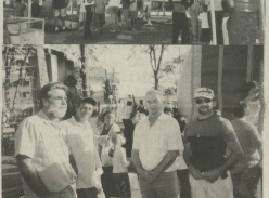
As crianças se esbaldando nos brinquedos, diretores e funcionários do Departamento de Esportes