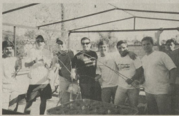
Jovens participando do evento